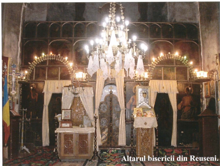
Altarul bisericii din Reuseni.