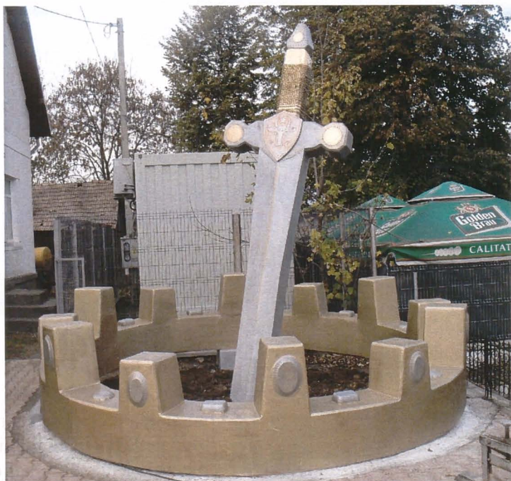
Monumentul comemorativ al trecerii a 560 de ani de la moartea lui Bogdan al II-lea, părinte al „celui mai mare român“ (finanțator: Primăria Udești; proiect și inițiator: prof. dr. Mugur Andronic).